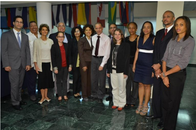
Les participants au séminaire de travail des 11 et 12 juillet : représentants de l'IdA, des universités impliquées, de l'Ambassade de France et du Ministère dominicain de l'éducation supérieure.

Le Pôle Caraïbe assure un suivi régulier du projet de création de Master; interlocuteur privilégié, il facilite les échanges entre les trois institutions impliquées, mais aussi entre celles-ci et d'autres potentiels partenaires et spécialistes de la région.