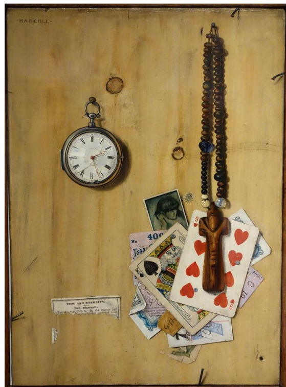
John Haberle, Time and Eternity , ca. 1889-90, New Britain Museum of Art

Over the past decades, a number of historical studies have demonstrated that time is not a straightforward or neutral framework. From discussing the emergence of standardized, rationalized time as concomitant with the rise of industrialization, to analysing the temporalities of colonialism, these studies have shown that the concept of time is historically determined and that it constantly evolves under the pressures of technological, social, and economic factors. Yet in the field of art history, and especially U.S. art history, studies devoted to time as it relates to the visual arts remain comparatively limited in scope and number. This symposium will address this absence by taking a long view at the development of the concept of time in American art and visual culture.